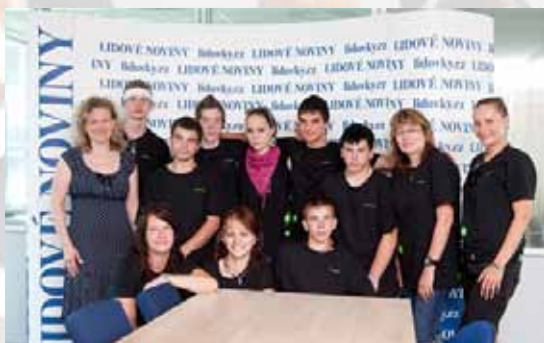
Dětské domovy navštívily Lidovky.cz 4. června 2011, 18:20